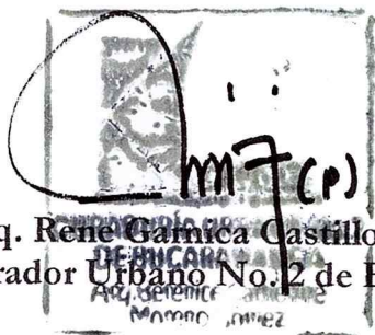
Arq. Rene Garnica Castillo Curador Urbano No. 2 de Bucaramanga (P) VC